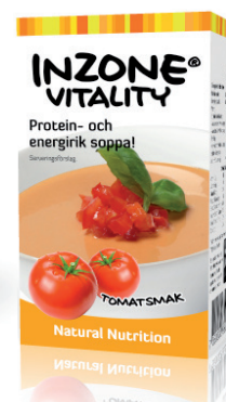
Tomat EPD 2975688