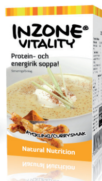
Kylling/Curry EPD 2975662