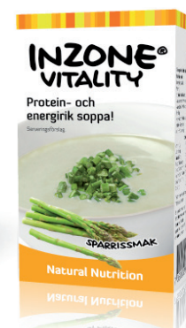
Asparges EPD 2975621